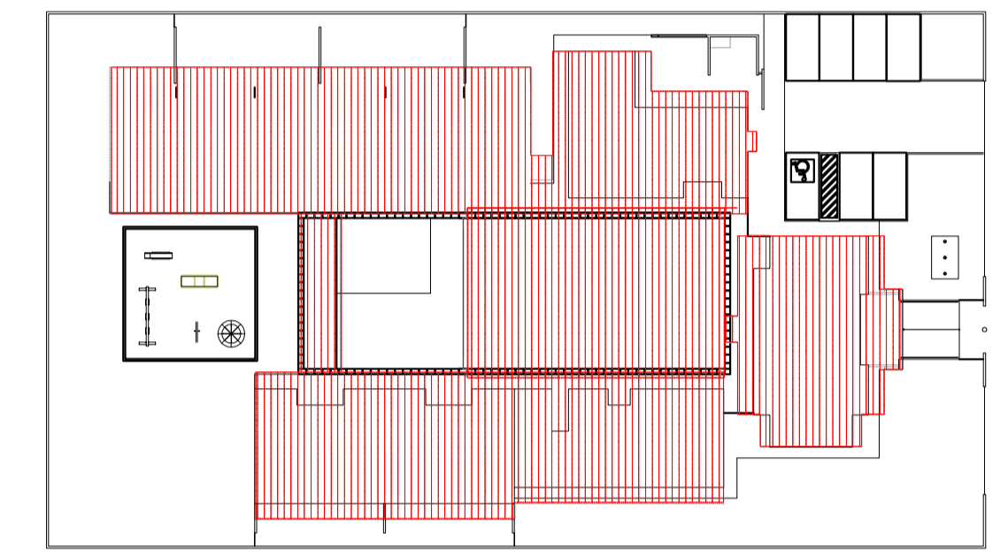
2 CROQUI DE REFERÊNCIA ESCALA 1/500